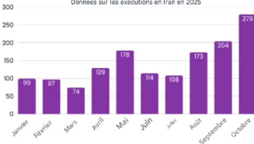
Données sur les exécutions en Iran en 2025