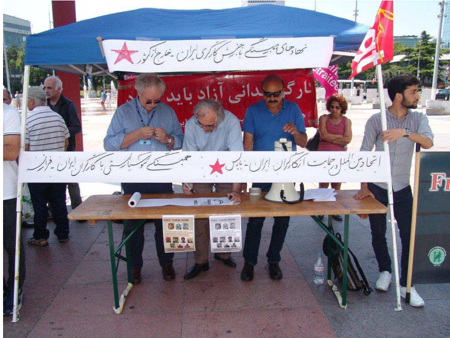
تظاهرات ۱۳ ژوئن در ژنو