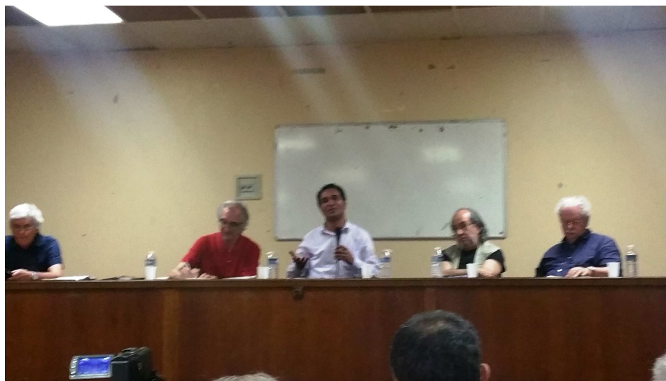
شب همبستگى با کارگران ايران در پاریس